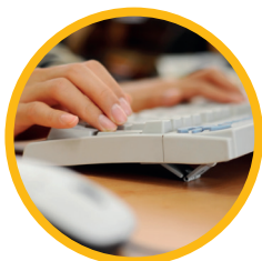
Propositions de financement